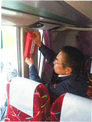
① 非常口レバーカバーをはずす