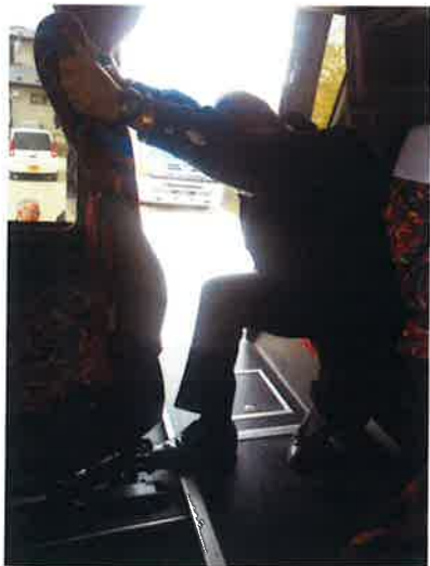
④ 座席を前に倒し通路確保